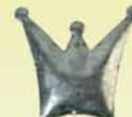
Couronne en fer-blanc, 14 x 12 cm réf. n° 25 062 00