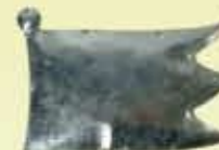
Drapeau en fer-blanc, 15,5 x 10,5 cm réf. n° 25 061 00