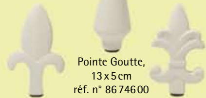
Pointe Goutte, 13x5 cm réf. n° 8674600