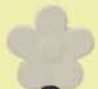
Pointe Fleur, 9 cm ø x 2,3 cm réf. n° 8674200