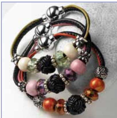
Des jolis bracelets aussi en d'autres combinaisons de couleurs.

Couper en biais avec des ciseaux 22 cm de bande en cuir synthétique ronde et 22 cm de lanière ronde en cuir de chèvre colorié, enfiler ensuite les perles ainsi que le nœud cravate (voir images point par point) et glisser au milieu. Raccourcir les lanières en cuir selon votre poignet et coller les bouts dans le fermoir magnétique.