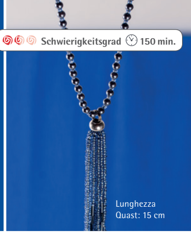
Lunghezza Quast: 15 cm